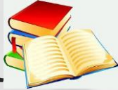
كتاب القران الكريم