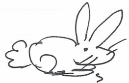
ر ا ب ب