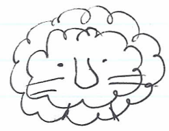
س ا د